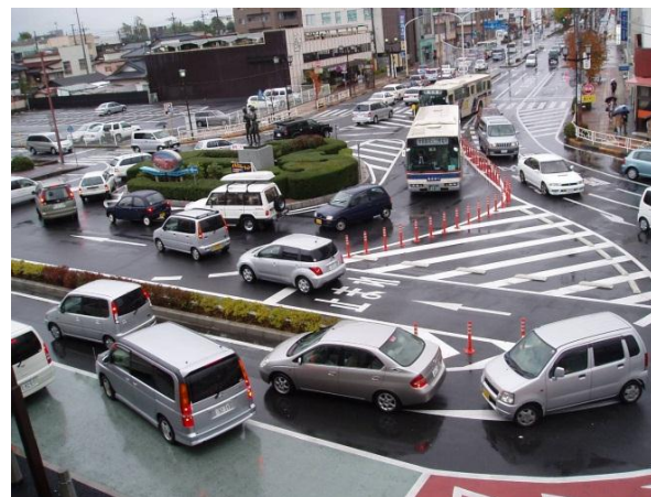
施行前の駅前広場の交通渋滞