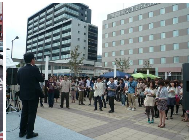
事業完了後に行われたイベントの様子