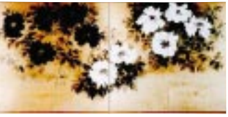
企画展 近代の水墨画 加山又造「牡丹」昭和54年富山県水墨美術館

当館は岡倉天心や五浦の作家たちの業績を紹介するとともに、展覧会をはじめとする美術鑑賞の機会を提供や、日本美術の情報を広く発信するなど、新たな芸術・文化活動の拠点を目指しています。