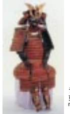
テーマ展 水戸の南面と水戸東照宮の名宝(8/29まで) 「紅糸威鳳丸具足」

水戸市緑町2-1-15 ☎ 029(225)4425 URL http://www.ibaraki-rekishikan.com/ 入館料 観覧料/一般150(120)円・高大生80(60)円・小中学生50(40)円 ( )内は20名以上の団体料金 開館時間/午前9時30分~午後5時 (入館は4時30分まで) 休館日/月曜日(祝日の場合は翌日休館)