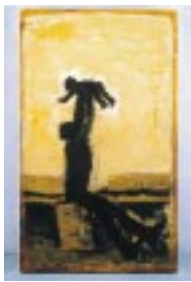
企画展 香月泰男展「父と子」 昭和42年 個人蔵