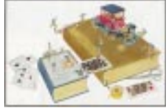
安野光雅「ふしぎなえ」(1968年)から ©Anno&Anno Art Museum 協力:津和野町立安野光雅美術館

つくば市吾妻2丁目8番 ☎ 029(856)3711 URL http://www.edu.pref.ibaraki.jp/tsukuba/ 入館料 企画展/展覧会ごとに設定 開館時間/午前9時30分~午後5時 (入館は4時30分まで) 休館日/月曜日(祝日の場合は翌日休館)